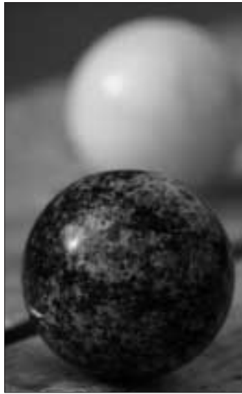
Den lille, blå kloden Tellus.