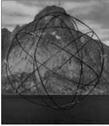
Sola, som alt kretser rundt, er ennå bare en modell.