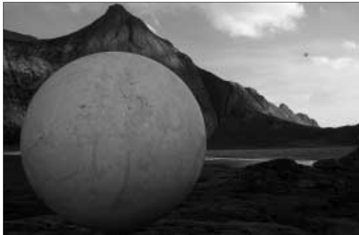
Saturn finner du på Bunesstranda i Moskenes.